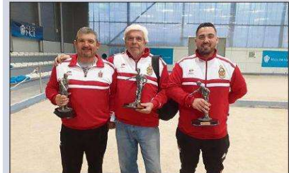
Impressionnante performance de la triplette du CBM à Nice.